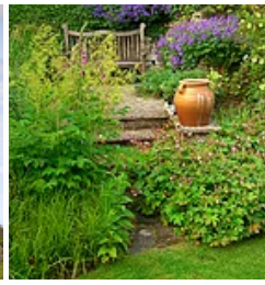
Bide-A-Wee Cottage Garden