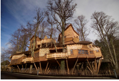
Restaurant des Alnwick Poison Garden

Damit die Reise gelingt, sind wir aber auch auf Ihre Mithilfe angewiesen. Bitte teilen Sie uns mit, wenn Sie besondere Wünsche haben. Gerne versuchen wir Ihre Anregungen in den Programmverlauf einzubinden.